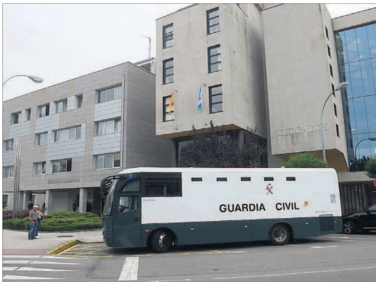
Un autobús de la Guardia Civil aparcado junto a los juzgados de Vilagarcía.

Los datos que ofrece el IGE muestran una tendencia similar tanto en Vilagarcía como en Cambados, con una caída progresiva en sendos partidos judiciales. Así, los juzgados de O Cavadelo cerraron el año pasado con 762 peticiones